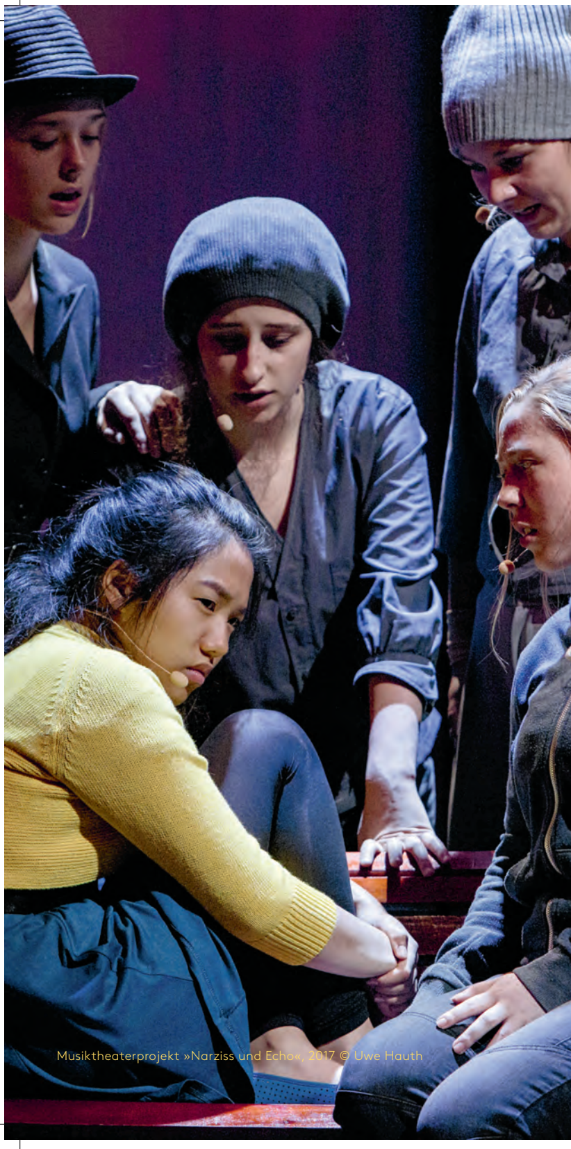
Musiktheaterprojekt »Narziss und Echo«, 2017